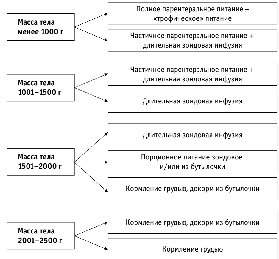
Рис. 2. Способы и методы вскармливания недоношенных детей в зависимости от массы тела (Национальная программа по оптимизации вскармливания детей первого года жизни в Российской Федерации, 2008)

Длительное зондовое питание проводится с помощью шприцевых инфузионных насосов. Существуют различные схемы проведения длительной инфузии (табл. 1).